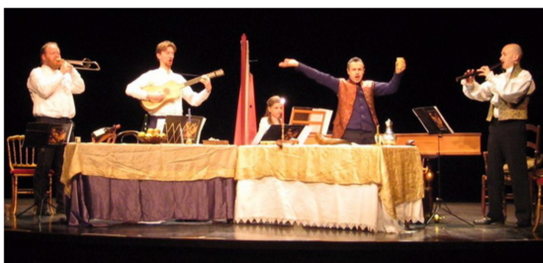
Théâtre de Sens - 5 février 2016

A l'approche du Printemps, un air nouveau souffle sur l'ensemble La Fenice : après une hibernation de quelques semaines, une équipe entièrement renouvelée nous a rejoints, et nous conduit vers un horizon aux couleurs Arc-en-ciel !