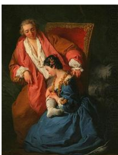
Pierre Subleyras, d'après un conte de Jean de La Fontaine