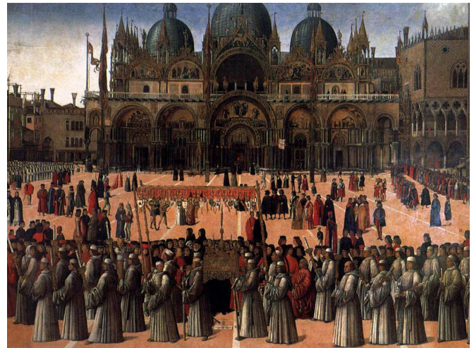
Gentile Bellini, Processione in piazza San Marco (Gallerie dell'Accademia, Venezia)

Giovanni Gabrieli : Canzon settima a 7 voci