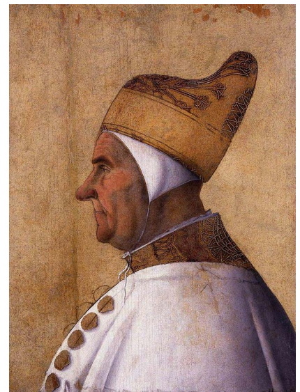
Gentile Bellini, Ritratto del Doge Giovanni Mocenigo (Museo Correr di Venezia)