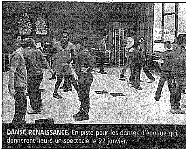
DANSE RENAISSANCE. En piste pour les danses d'époque qui donneront lieu à un spectacle le 22 janvier.